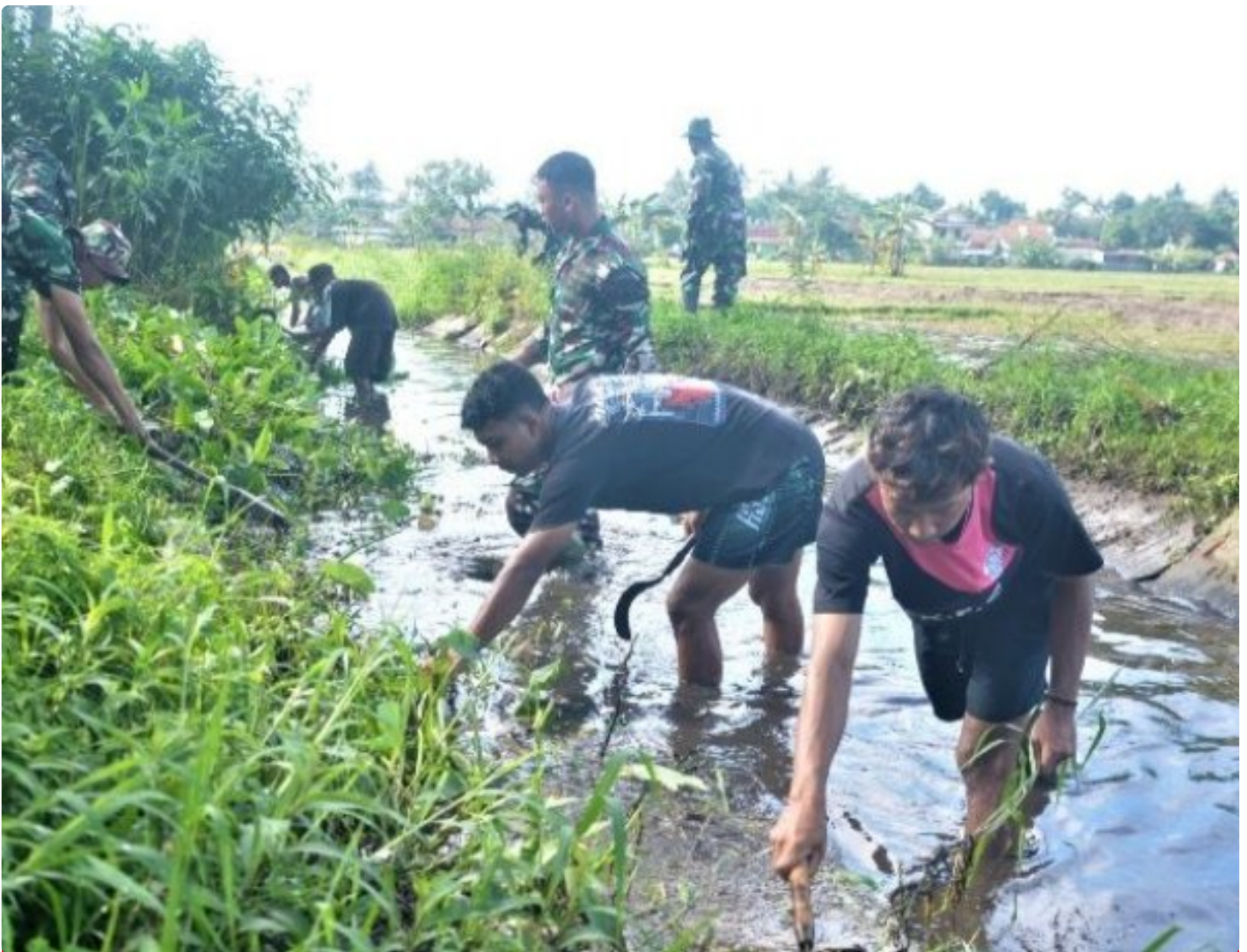
Sungai Si Rompang dibersihkan TNI Korem 071 Wijaya Kusuma

BANYUMAS - Sungai Si Rompang atau kali dalam sebutan masyarakat Banyumas, yang melintas tepat di belakang lingkungan Makorem